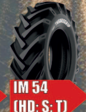
IM 54 (HD; S; T)