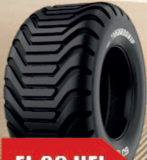
FL 09 HFL