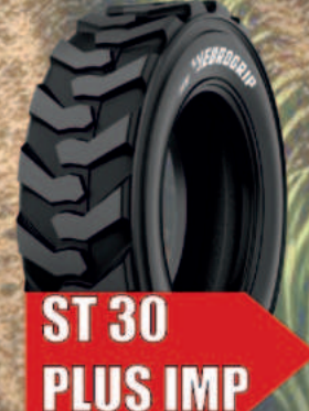
ST 30 PLUS IMP