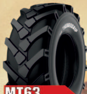
MT63 (HD, T, L)