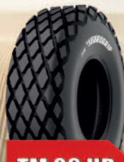
TM 09 HD