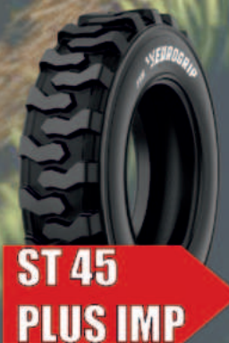
ST 45 PLUS IMP